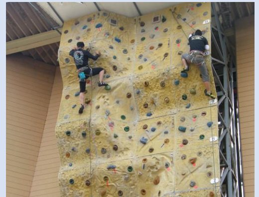
トップロープクライミングの様子