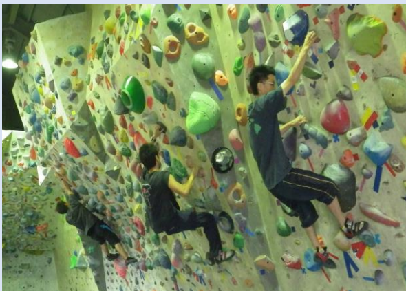
ボルダリングの様子

参加希望日、住所、氏名、電話番号、生年月日(保険加入の為)を明記の上、FAX、メール、かがやきネットやまぐちのいずれかで、それぞれの申込締切日までにお申込みください。定員を超えた場合は抽選とし、申込まれた方全員に結果をお知らせします。