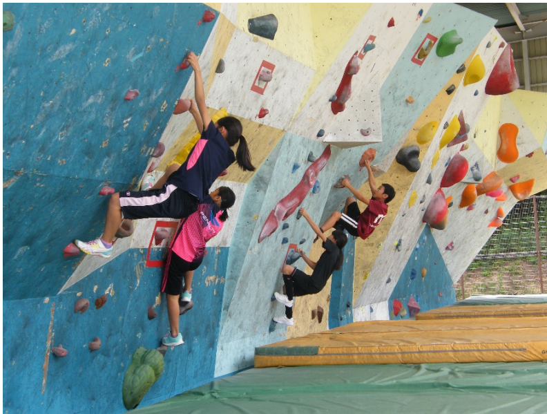
ボルダリングの様子

山口県在住の方で、ボルダリング又はトップロープクライミングの体験を希望する団体(グループ)です。初心者の方も可能です。